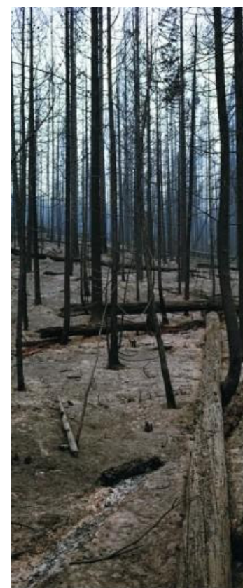
...y años en recuperarse

La prevención es la manera más eficaz de luchar contra los incendios forestales.